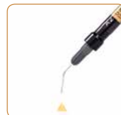
901503 - Appliseringsspiss Lang appliseringsnål (30 stk.)