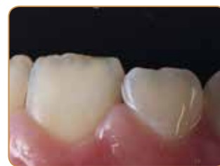
Perfekt integrering ved recall-besøk