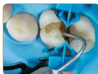
Undersnitt kan enkelt nåes med de bøyelige spissene