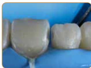
Opprinnelige Klasse III-kaviteter