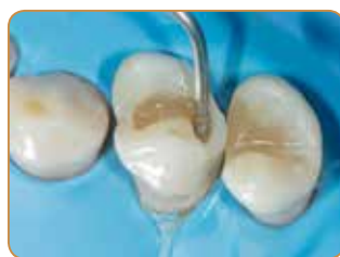
En klasse I-prosedyre kan nå begynnes; dentinskiktet lages med A4-farge