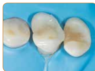
Det endelige emaljelaget settes med JE-fargen