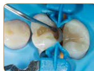
Den aproximale veggen bygges opp med emaljefarge JE