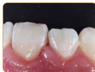
Resultatet direkte etter behandlingen