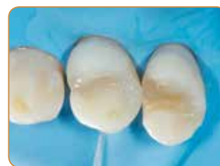
Sluttresultatet etter finishing og polering av kanttilslutningene