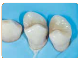
Opprinnelig situasjon med aproximalkaries