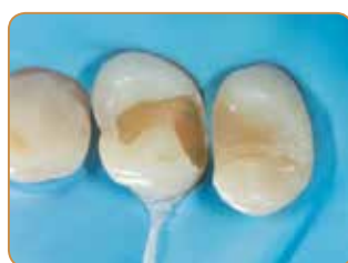
Fjerning av gammel fylling og ekskavering av karies