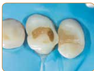
Fjerning av seksjonsmatrise etter at den aproximale veggen er bygget opp