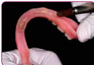
Ru opp overflaten i området som skal rebaseres.