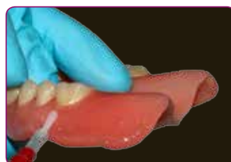
Kantavslutningene beskyttes ytterligere med finisheringsmaterialet Reline II

Med Reline II skjer det ingen varmeutvikling når materialet stivner, hvilket gir pasienten en behageligere opplevelse. Materialet beholder sine myke og luktfrie egenskaper og til og med sin stabilitet og elastisitet i flere uker eller opp til flere måneder. Resultatet? En holdbar og enkel løsning for protesepasienter.