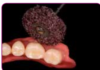
Finishér med RELINE II FINISHERINGSJUL.