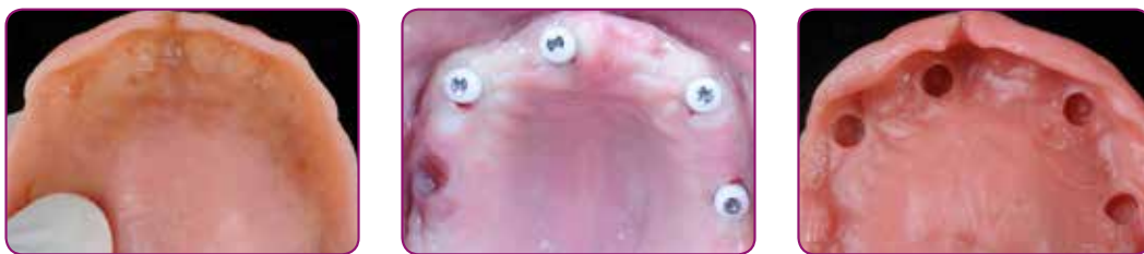
Bildene gjengis med tillatelse av Dr. Garcia-Baeza, Spania.

Reline II Soft og Extra Soft fra GC skaper et mykt lag mellom protesen og mukosa, noe som fører til at protesen effektivt tilpasses de nye, lokale forholdene. Dette forenkler tilheling med beholdt komfort og funksjon i flere uker og opp til mange måneder.