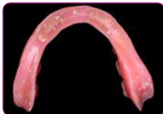
Protese for rebasering etter plassering av fire implantater.