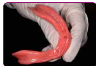
Protesen er rebasert.