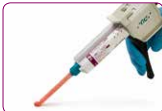
Enkel applisering med direkteteknikk.