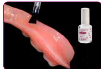
Appliser RELINE II PRIMER på området som skal rebaseres. Blås forsiktig med luft.