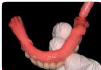
Appliser GC RELINE II (Extra) Soft. Arbeidstiden er 2 min.