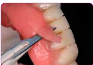
Fjern overskuddsmateriale med skalpell eller saks. Trim med RELINE II TRIMMESPISS.