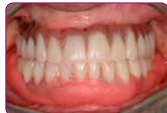
Plassér protesen i pasientens munn og trim musklene. La sitte på plass i 5 min.