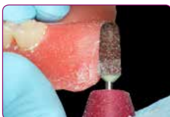
Bedre trimmingsegenskaper gjør finishering av kantavslutningene enklere

Materialets viskositet gjør at det flyter godt ut under trykk og formes perfekt til alle anatomiske detaljer. Fordi materialet er lett å trimme blir den siste finishering av kantavslutningen enda enklere.